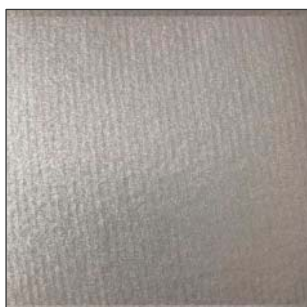
FR 9 (flame retardant)

Kühl und trocken lagern; vor Lichteinwirkung bei Lagerung schützen. Wir empfehlen, eine Lagerzeit von 12 Monaten nicht zu überschreiten. Die technischen Angaben beruhen auf umfangreichen Versuchen und technischen Recherchen. Wegen der Vielfalt möglicher Einflüsse bei der Veredelung und Verwendung sind die Angaben jedoch als Richtwerte zu sehen. Wir empfehlen eine Eignungsprüfung am Originalmaterial. Eine rechtlich verbindliche Zusicherung bestimmter Eigenschaften kann aus unseren Angaben nicht abgeleitet werden.