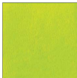
NEON YELLOW 4 (flame retardant)